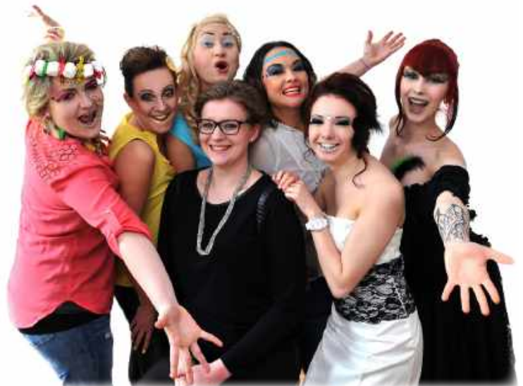
Teilnehmerinnen unserer Visagistenausbildung

Unser umfangreiches Angebot an Weiterbildungen und Zusatzqualifikationen ist modular aufgebaut, so dass Sie die für Sie interessanten Bausteine auswählen und auch kombinieren können. Wir beraten Sie sehr gerne. Umfangreiche Informationen haben wir auf unserer Webseite zusammengestellt: www.bamberger-kosmetikschule.de/weiterbildung.html