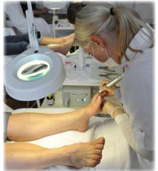
Praktische Übung am Modell

Allerdings: Man hat bis zu zwei Jahre früher seinen Abschluss in der Tasche und verdient Geld. Beim Schulgeld handelt es sich also nicht nur um Kosten, sondern um eine rentable Investition in die eigene Zukunft!