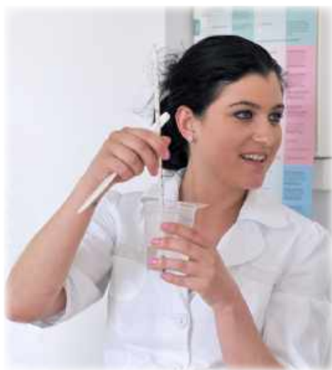
Freude am Lernen in der praktischen Ausbildung

...IN TEILZEIT: Sie sind bereits angestellt, selbstständig, oder aus anderen Gründen während der Woche ausgelastet? - Speziell für Sie bieten wir unsere Samstagskurse an. Sie erlernen dieselben Inhalte wie unsere Vollzeitschülerinnen, und Sie erhalten den gleichen Abschluss, als Kosmetikerin und / oder Fußpflegerin. Der Unterricht findet an Samstagen statt, von 9 Uhr bis etwa 15 Uhr. Die Samstagsausbildung umfasst deutlich weniger Unterrichtstage als unsere Vollzeitkurse, bei gleichen Lerninhalten. Daher sind die Anforderungen an unsere Teilzeit-Schülerinnen etwas intensiver. Auch müssen Sie in der Samstagsausbildung mit weniger Ferienzeiten rechnen.