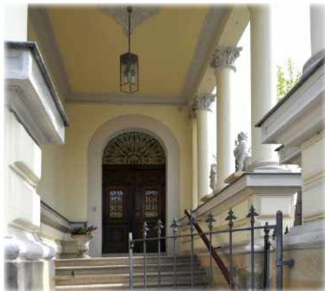
Der Eingang zu unserer Schule in der wunderschönen Bamberger Altstadt