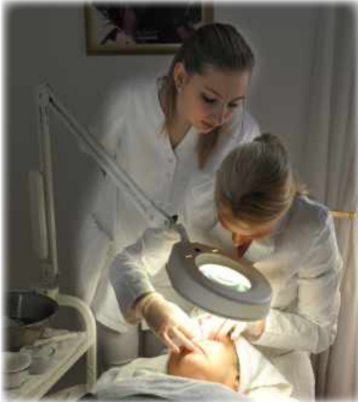
Individuelle und intensive Betreuung während der Ausbildung ist für uns selbstverständlich.

BERUFSFACHSCHULEN sind nicht das Gleiche wie Berufsschulen, auch wenn man die Bezeichnungen leicht verwechseln kann.